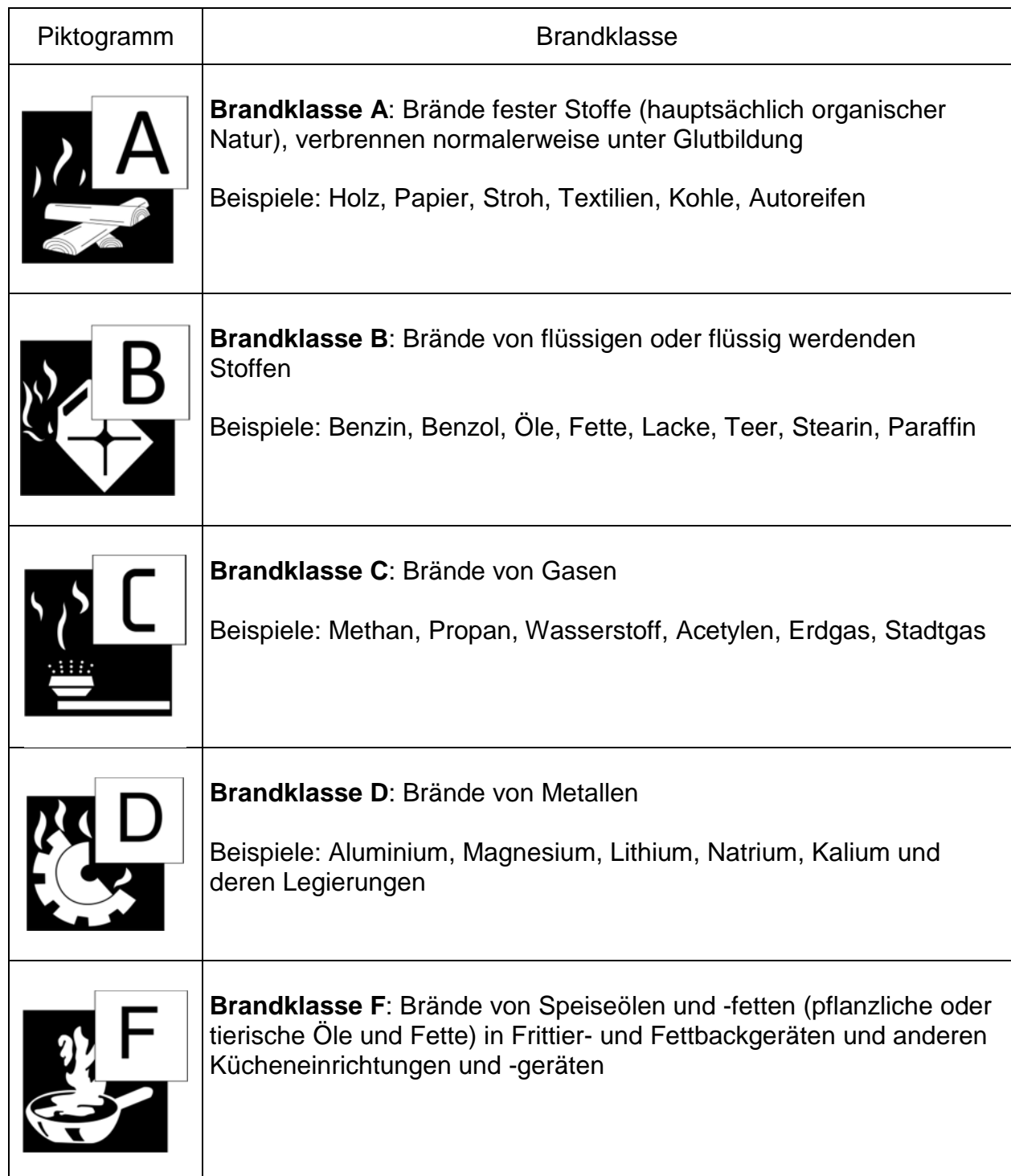
Tabelle 1: Brandklassen nach DIN EN 2 „Brandklassen“ Ausgabe Januar 2005